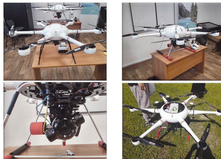
GAIA 160 және GAIA120 (тікушақ типті) ұшқышсыз ұшу аппараты: оптикалық камера, мультиспектрлі камера және лидар

135 жер серіктің көмегімен 24 сағат, яғни тәулік бойы алынғандықтан зерттеу нәтижесінің дәл шығуына септігін тигізеді. Екіншіден, орталықтағы SuperCam350, Gaia 160 және Gaia 120 оптикалық және мультиспектрлі камералары бар ұшқышсыз ұшу аппаратын қолдана отырып ауқымды мәліметтерге қол жеткіземіз. Ұшқышсыз ұшу аппаратында көп спектрлі камералар мен лазерлік лидар, жылу