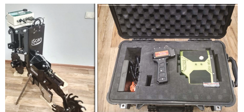
VERIS ISCAN зертханалық кешені

реттеу үшін соңғы үлгідегі цифрлық технологияларды қолданады. Шығыс Қазақстан және Солтүстік Қазақстан облыстарында 35 мың гектардан астам жерге ауыл шаруашылығы дақылдарын егумен айналысатын бұл компанияда 450-ге жуық қызметкер жұмыс істейді. Aitas Agro алқаптарында күнбағыс, жаздық және күздік бидай, сыра қайнататын арпа, бұршақ, жасмыс, рапс сияқты түрлі дәнді және майлы дақылдар өсіріледі. Егістік өнімділігі жылына шамамен 70-80 мың тонна өнімді құрайды. Компания өкілдерінің мәлімдеуінше, мекеме процесті басқарудың CROPWISE, ERP және BI аналитикасы секілді үш компоненттен тұратын бірыңғай цифрлық жүйесін қолданады.